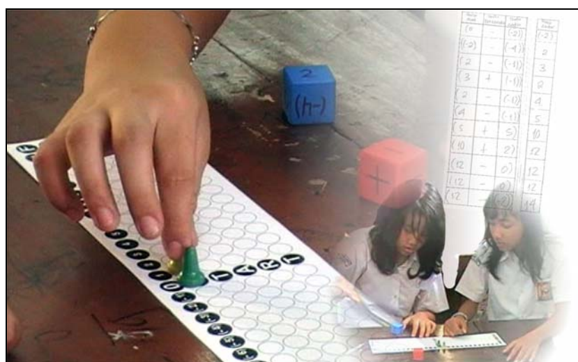
Abb. 8: Partnerarbeit: Würfeln, die Spielfiguren bewegen, danach die Spielzüge formal darstellen

Da das Spiel in Partnerarbeit gespielt werden soll, ist seine Durchführung ein Beitrag zum kooperativen Lernen.